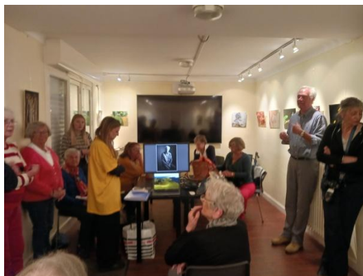
Choix du portrait final sur ordinateur.