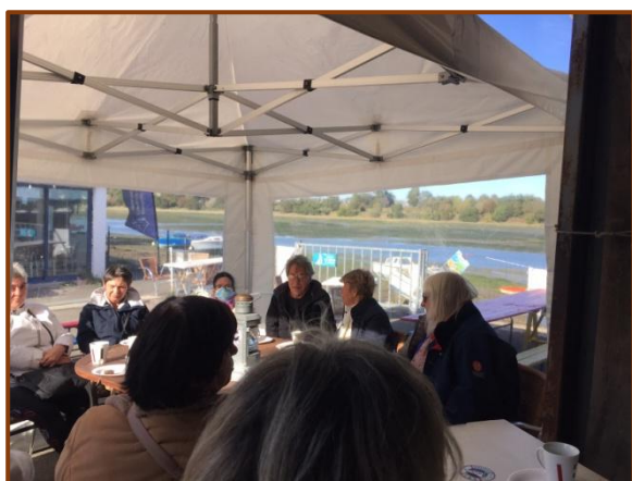
Goûter à la SRV