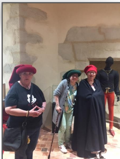
... de ces dames...