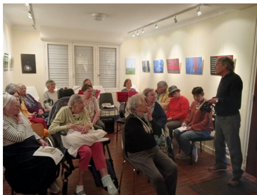
Initiation aux secrets de la photographie.