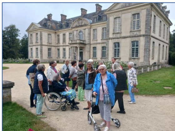
Château de Kerguéhenec