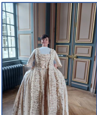
Oh la belle marquise