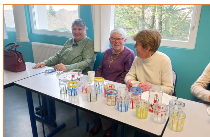
Et voilà le travail. La professeure a l'air satisfaite!