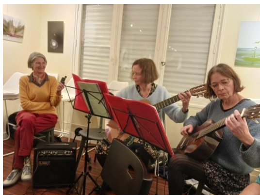
Nos 2 artistes chanteuses et guitaristes.