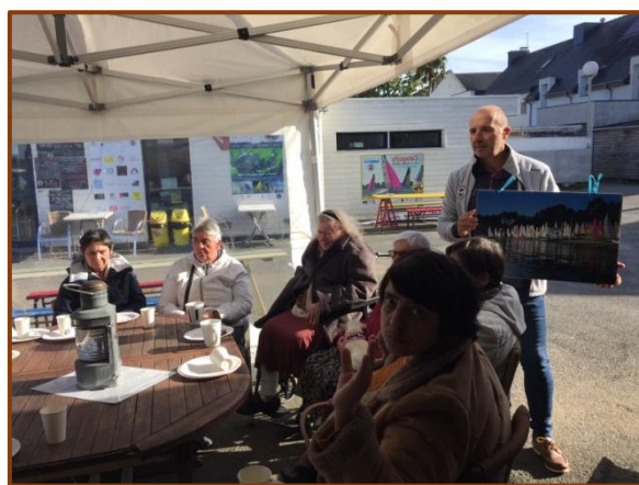
Histoire de la SRV par Erik