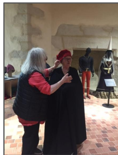
... A la "garde Robe" du château